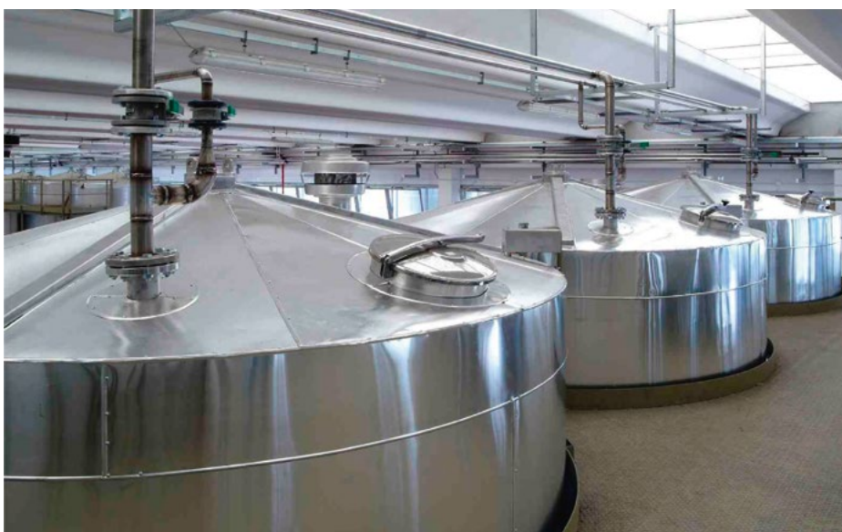
Рисунок 1. Производственный цех завода Биопротон в Брисбене

Совместно с университетом Квинсленда специалисты «Биопротон ПиТиВай ЛТД» продолжают вести работу по развитию новых направлений, улучшению эффективности и рентабельности процесса производства, повышению контроля и качества при формировании зерновых и соевых рационов для сельскохозяйственных животных и птицы, рыб и креветок. «Биопротон» активно развивает новые направления совместно с университетом Квинсленда.