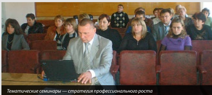
Тематические семинары — стратегия профессионального роста

Проводимые нами семинары становятся все более популярными!