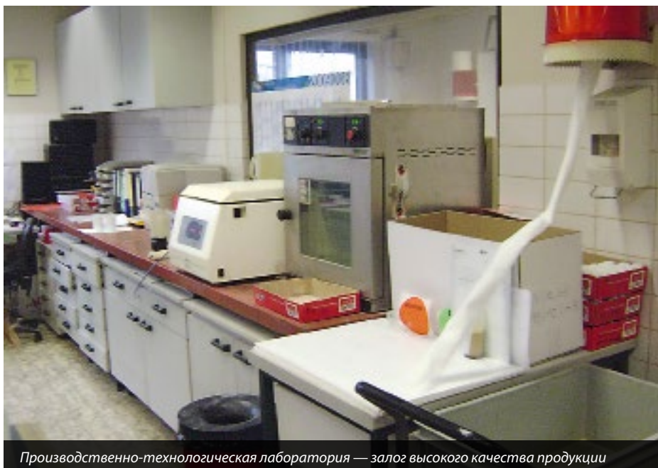
Производственно-технологическая лаборатория — залог высокого качества продукции

Основываясь на расчетных данных программы и учитывая то, что недостаток обменной энергии в корме является наиболее частой причиной низкой продуктивности птицы, чем недостаток аминокислот и витаминов, с целью обеспечения энергетической ценности ре-