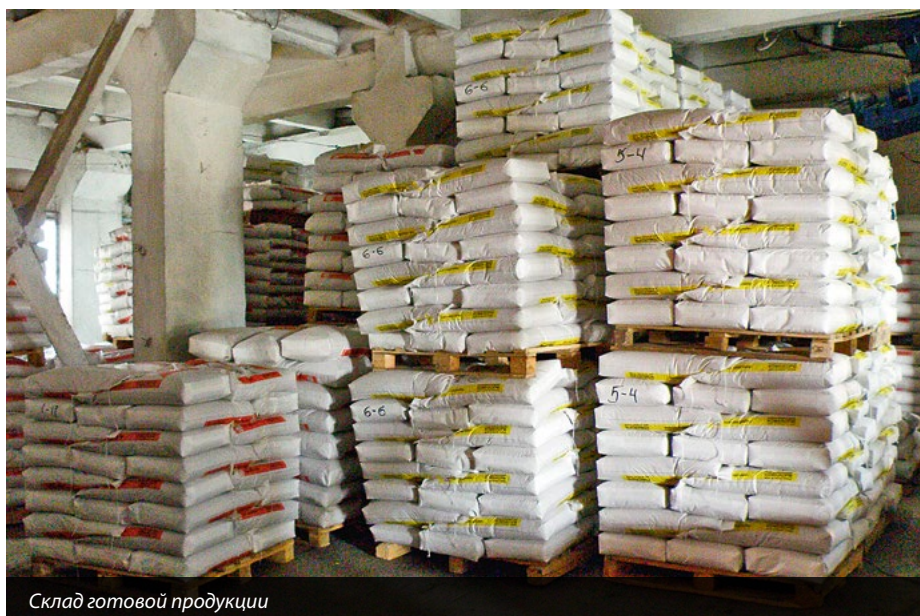
Склад готовой продукции

Эффективные рецептуры позволяют добиться оптимального содержания и соответствия витаминов, микроэлементов, аминокислот в наших концентратах, которые помогают решать самые