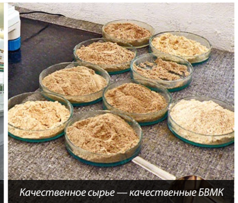
Качественное сырье — качественные БВМК