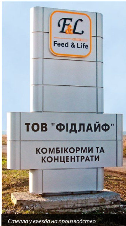
Стелла у в'їзді на виробництво