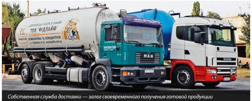
Собственная служба доставки — залог своевременного получения готовой продукции