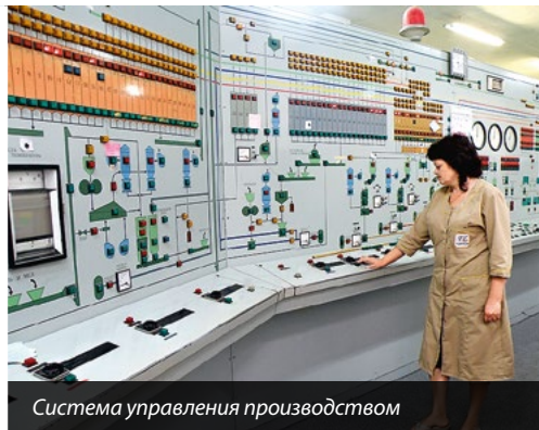
Система управління виробництвом