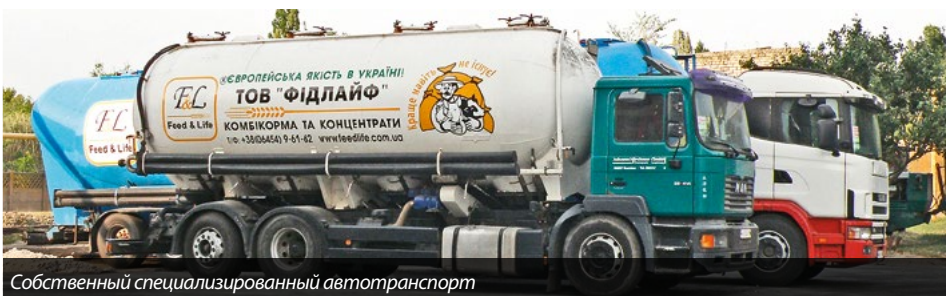
Собственный специализированный автотранспорт