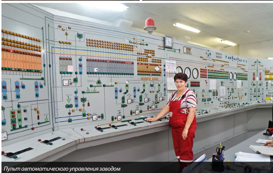
Пульт автоматического управления заводом