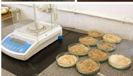
Образцы сырья и готовой продукции