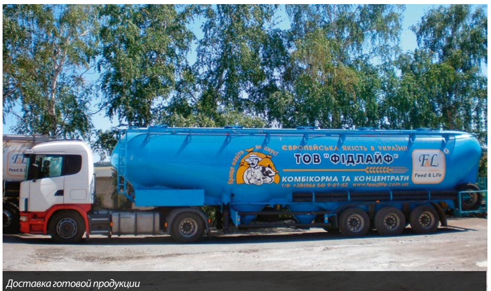
Доставка готовой продукции