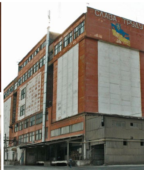
Технологическое здание завода